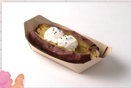
汁モレしない 舟形紙トレー

『コグマ』は韓国語でさつまいもを指す言葉です。 韓国で食べられているさつまいものスイーツを 日本では「コグマスイーツ」と呼んでいます。 さつまいもが大好きな韓国では大人気のスイーツです。