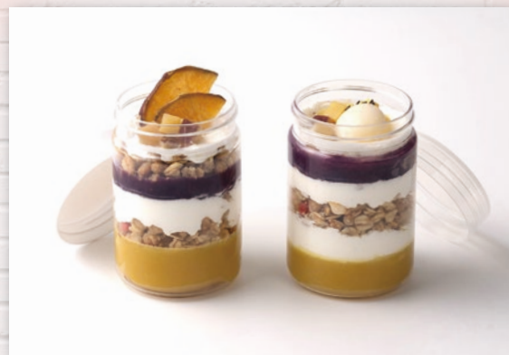
PET-N65φ-P270本体 N65φフタ(白・透明)